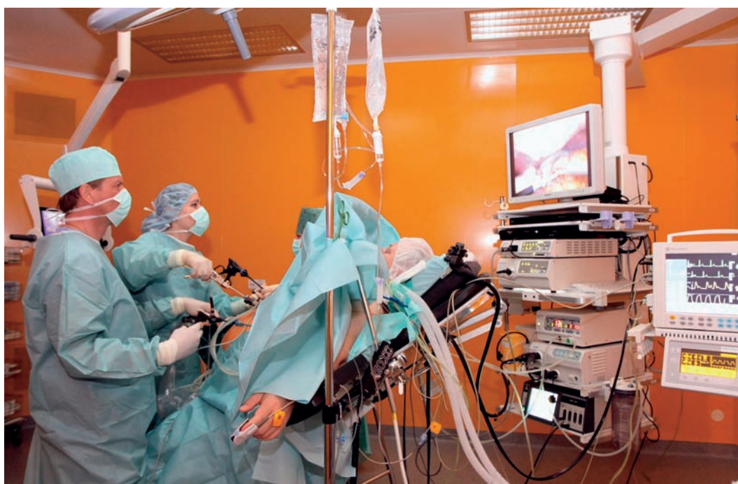
Kromě služeb mnoha ambulantních lékařů-specialistů má OB klinika k dispozici dva operační sály vybavené nejmodernější technikou pro různé typy chirurgických operací a zákroků, 24 standardních lůžek a 4 lůžka intenzivní péče

„Pacienti s obezitou mohou být léčeni například pomocí odborně sestaveného dietního režimu, případně kombinovaného s léky usnadňujícími hubnutí, psychologickou podporou a individuálně se-