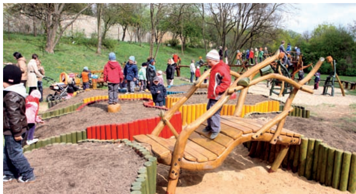
Květinové hřiště dostalo svůj název podle květinových prvků na něm

Jedinečné a svého druhu první hřiště nejen pro děti bylo 14. dubna otevřeno na Krocínce na Proseku.