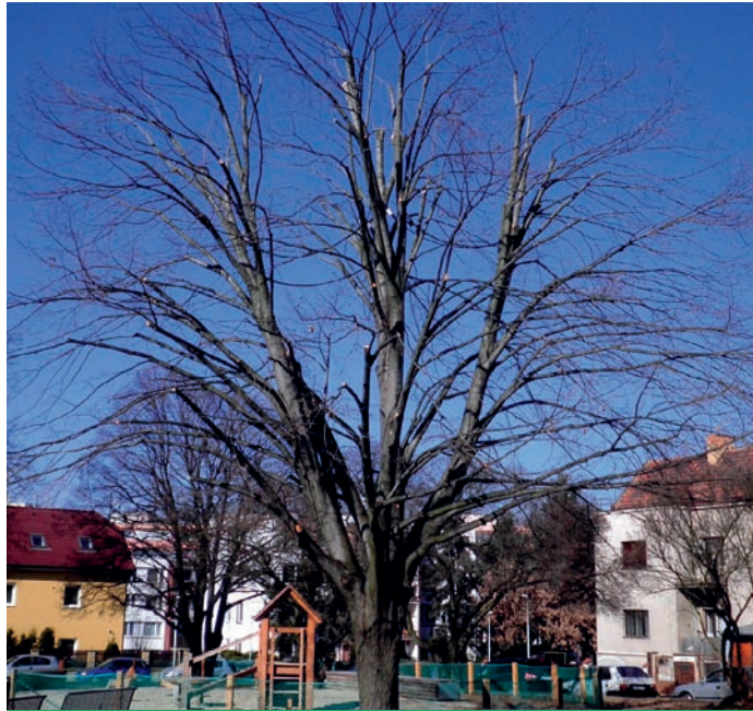
Lípu stříbrnou v parcíku při ulici K Šafránci zachránily před pokácením obvodové redukční řezy

Setkáváme se však s případy, kdy strom má vážný růstový defekt, který by mohl být již důvodem k pokácení, avšak jinak je relativně zdravý, vitální a na svém stanovišti je do jisté míry „nepostradatelný“. Jedním z takových příkladů, které odbor životního prostředí v ne-