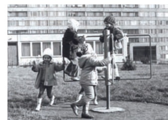
Školka Veltruská v roce 1971... a dnes