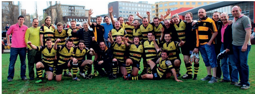
Vítězný tým Prahy se po utkání se Spartou vyfotografoval spolu se zástupci radnice Prahy 9

Čeští ragbisté letos na jaře nadstavbovou část své nejvyšší soutěže extraligy hrají ve dvou skupinách. Ta silnější se nazývá TOP 6 a o mistrovský titul v ní usilují i tradiční soupeři Sparta a Praga. Vítěz derby získává navíc pohár předávaný představiteli Prahy 9, a proto má utkání zvláštní atmosféru.