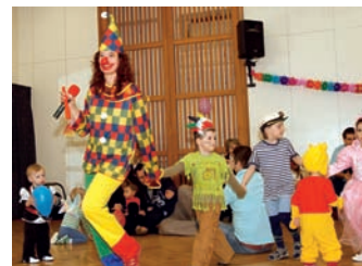
Karneval s klaunem a pohádkou

Program v CVČ na Proseku je od 16.30 do 18.00 určen dětem od 1 do 7 let s doprovodem. Těšit se můžete na soutěže a tanečky s klaunem, krátkou maňáskovou pohádkou, kejklířku a také přijde kouzelník. Vstupné 99 Kč/dospělý a 99 Kč/dítě. Kapacita sálu je omezená, proto si rezervujte místo na e-mail: hratkysbatolatky@seznam.cz nebo v SMS na tel.: 605 219 555.