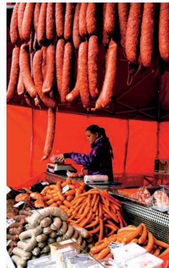
Když jitrničky a klobásy, tak jen domácí...