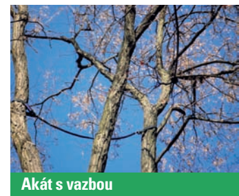
Akát s vazbou

vávají původní korunu, stabilizovat. Přesto však požadavek na jeho zachování je zcela jasný a zásadní – zachovat významnou soliternu v její funkci co nejdéle, ale zajistit odpovídající provozní bezpečnost. Defektní vidličnatá větvení jsou