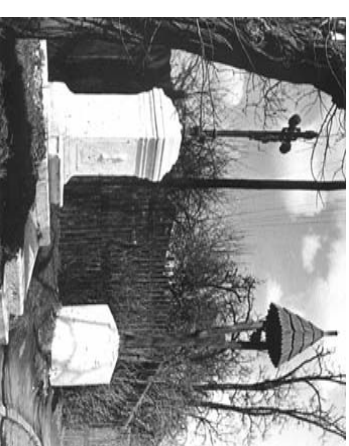
Světázne vysočanské záústi

Zvonička ve tvaru složené rozsochy byla dlouhá, vřady místních řemeslníků. Jednotlivé její díly podléhaly víchem počasí zkáze a byly průběžně vyměňovány za nové části - dřevěné i kovové.