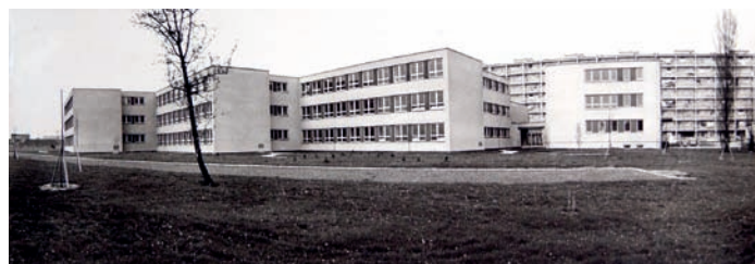
Základní škola Litvínovská 600 byla otevřena v roce 1971

Srdečně zveme všechny - bývalé žáky, pedagogy, rodiče dětí současných i minulých - kteří mají chuť projít se částí své minulosti a zjistit, jak (na rozdíl od nás lidí) mohou místa mládnout.