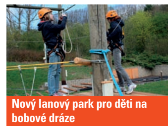
Nový lanový park pro děti na bobové dráze

dávaným místem Pražanů již od svého zprovoznění v roce 2003. Téměř 800 metrů dlouhá bobová dráha umožňuje adrenalinovou jízdu rychlostí téměř 60 km/hod. Kromě dráhy je v areálu také lanový park pro dospělé i děti a 180