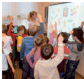
Při Školním těšení bylo živo u interaktivní tabule