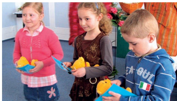
Z „devítkového“ kola recitační přehlídky Pražské poetické setkání

Stejně jako loni si své recitační umění vyzkoušeli žáci z prvních ročníků ZŠ, a to v nepostupové nulté kategorii. Po vystoupení třech odvážlivců následovali další, kteří postoupili ze školních kol jak základních, tak víceletých gymná-