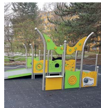
Přijďte slavnostně otevřít hřiště v DC Paprsek

Po roce příprav projektu a získávání finančních prostředků, které nakonec dosáhly částky více než 800 000 Kč, bylo hřiště za dva