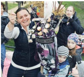
S oteplením v Edu Bubo Klubu přivítali jaro a po tvoření v dílničce společně hodili Moranu do řeky Rokytky

V průběhu teplého května se můžete těšit na sportovní závody v parku, postupně začínají i dětské kroužky, které se konají venku (Klokánci nebo Já a příroda) a pro rodiče bude přednáška o rodinné politice, rodičovské, otcovské dovolené, dětských skupinách a podobně. Bližší informace o akcích a přesných termínech