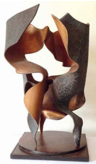
Jaroslav Křížek: Tanec stínů

Svorný nesoulad nebo ne- svorný soulad, zdánlivě oboje vyjadřuje totéž, ale není to