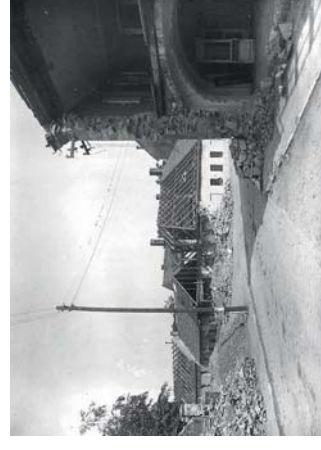
Uličky pod vysočanskou radnicí po náletu

ČNR jednala s Vlasovci o další pomoci, ale pro vnitřní rozpory v ČNR (proti byl Smrkovský – KSČ), k dohodě nedošlo. Vlasovci opustili Prahu.