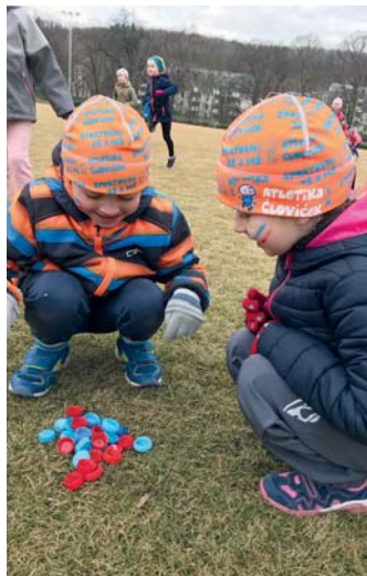
Jestliže se hýbeš rád, Človíčkem se můžeš stát!

Zcela nezávazně si vaše dítě může vyzkoušet trénink v rámci naší ukázkové hodiny ve středu 22. května 2019 od 16.30 hodin v parku Podvíní (nedaleko altánku) . Zde také zahájíme zápisy nováčků pro další školní rok 2019/2020. Naši trenéři vám rádi zodpoví všechny případné dotazy. Všichni malí