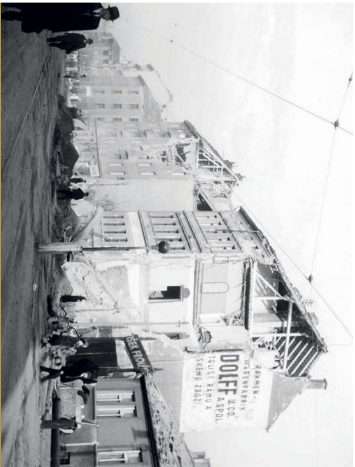
Konec války v Karlovské třídě, dnešní Sokolovské ulici. Pohled směrem ke Kovářské ulici.

či, kteří ze střešech a oken stříleli na civilisty a rudarmějce.