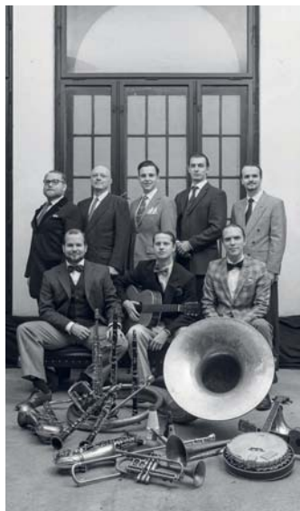
Originální pražský synkopický orchestr

To je to, o co se OPSO nikdy snažit nebude. Swingových kapel je poměrně hodně a my-