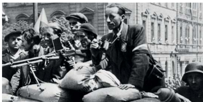
MĚSTSKÁ ČÁST PRAHA 9 POŘÁDÁ DNE 25. 5. 2019 V ULICI NAD KOLČAVKOU U PIVOVARU KOLČAVKA