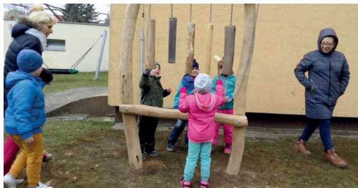
Dendrofon. Projekt „Smyslová zahrada“ je financován Státním fondem životního prostředí České republiky na základě rozhodnutí ministra životního prostředí.