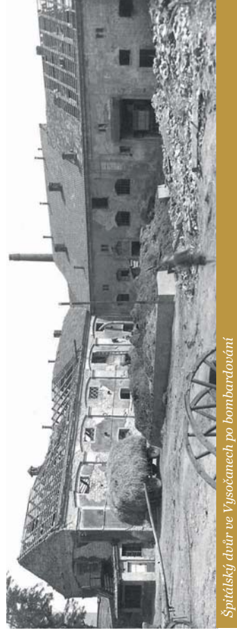
Špitálský dvůr ve Vysočanech po bombardování

V noci z 6. na 7. května projela Prahou mise americké armády k maršálu Schörmerovi. 7. května probíhaly boje v centru Prahy, bojovalo se u Staroměstské radnice. Tam postup tanků zastavili partyzáni z Hořovic, všichni padli.