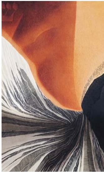
Lenka Vojtová: 21 ŠIN Kam se smrtelníci v zástupech valí

*1952 v Praze 1967–1970 SVVŠ Arabská 1971–1972 ČVUT stavební fa- kulta