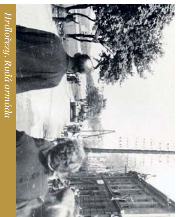
Hřbitovní. Rudá armáda

Koncem dubna 1945 se od západu blížily k našim hranicím spojenecké armády. Rudá armáda po překročení Odry zahájila bitvu o Berlín. Východní Slovensko již bylo osvobozeno a v Košicích zasedala československá vláda. Po boju sovětských vojáků osvobozovali svou vlast českoslovensí vojači Svobodovy armády, bojovalo se v údolí Váhu a na Fatře. Bratislava již byla svobodná, fronta se blížila k Brnu, začínala Ostravská operace. Přes pohraniční hory bylo slyšet dunění děl.