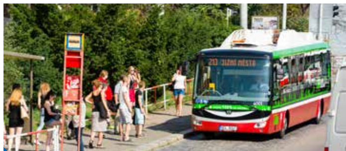
Elektrobus SOR EBN 11

Elektrobusesy s dynamickým dobíjením se na lince 140 poprvé objeví během podzimu a jejich testování potrvá rok. „Jestliže se osvědčí, počítá Dopravní podnik Praha s jejich nasazením i na páteřních linkách, které spojují okraje města s centrem. A tady musí