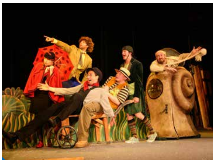
Příhody Ferdý Mravence se vrací na prkna Divadla Gong