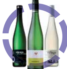
KVALITNÍ MORAVSKÁ VÍNA