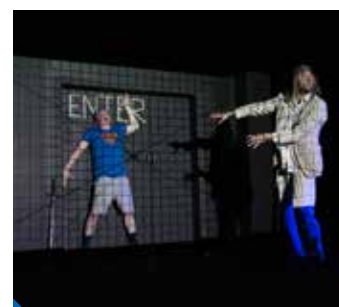
Z představení (Ne)bezpečná (ko)média