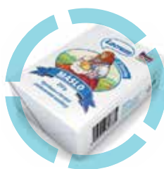
MLÉKO A MLÉČNÉ VÝROBKY