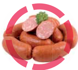
KVALITNÍ MASO A UZENINY

Připravili jsme pro Vás širokou nabídku kvalitních českých potravin z vlastních sadů a farem. Konečně mají možnost nákupu i ti, kteří preferují kvalitní a české potraviny. A to za velmi příznivé ceny!