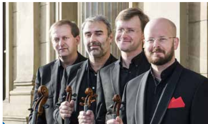
České filharmonické kvarteto

natočit na své CD. Projekt podpořila Nadace Život umělce. ▶