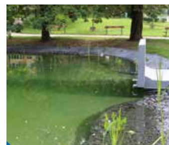
Dnes se už obyvatelé Proseka a Střížkova mohou těšit z vodní plochy

Revitalizace rybníčku proběhla v létě od základů. Nádrž byla upravena tak, aby její dno mohlo být pokryto fólií, která by zabránila mizení vody. Nový je rovněž systém přívodu vody. Kolem základní vodní plochy je postavena malá hráz z košů z geomříží a kamenů, v níž jsou vysázeny vodní rostliny. Vše je dosypáno štěrkem, který sahá až na břeh. Ten zároveň působí jako přirozený přírodní filtr na pročištění vody.