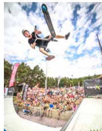
U rampa v parku Přátelství čeká na profesionály i soutěžící amatéry

Poprvé na Devítce budou mít návštěvníci možnost vidět exhibici na u-rampě z dílny VSA Xtreme. Mobilní minirampa bude připravena pro vystoupe-