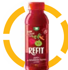
ZELENINOVÉ A OVOCNÉ ŠTÁVY