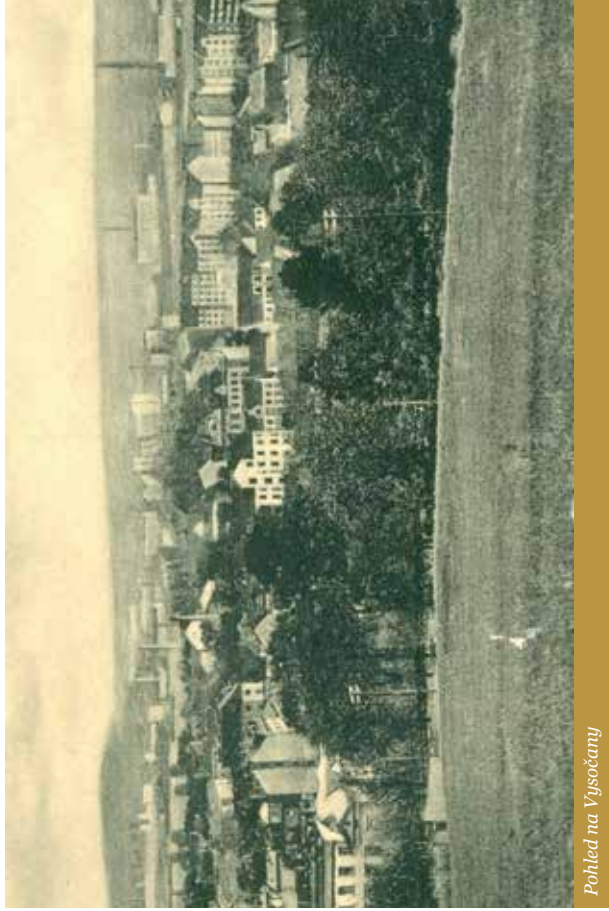
Pohled na Vysočany