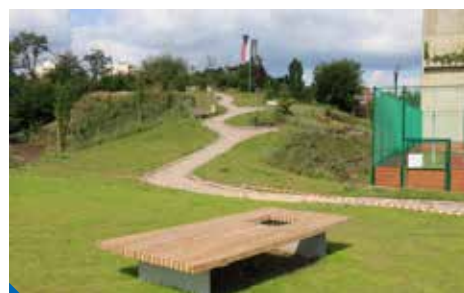
Nový park v areálu Prosek Park