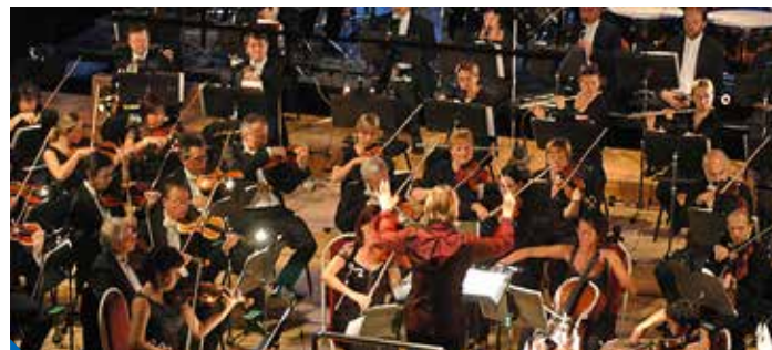
Orchester Sinfonietta Praga

Requiem, tajemná zádušní mše, je pravý důkaz Mozartovy geniality. Rozhodně si nenechte ujít tento mimořádný večer a přijďte před devatenáctou hodinou do parku Přátelství na Proseku.