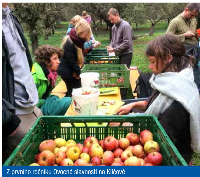
Z prvního ročníku Ovocné slavnosti na Klíčově

A ť jsi začátečník, nebo trénovaný sportovec, tak tohle zkrátka dáš! Běh – pod záštitou MČ Praha 9 – je situovaný do exkluzivního prostředí bývalé továrny Pragovka. Jedná se o první městský překážkový běh svého druhu v České republice a na závodníky čeká přeskokování aut, lezení přes kontejnery, běh atomovým krytem a mnoho dalších výzev. Pokud nějakou překážku nezládnete, trestat vás nebudeme, ale musíte mít čisté svědomí, že jste pro její překonání udělali maximum. Pro děti je připravena speciální překážková dráha v zázemí akce. Celý den se těšte na bohatý doprovodný program. Občerstvení zajištěno. Registrace běží na www.urbanchallenge.cz/registrace . Doporučujeme sledovat i Facebook- www.facebook.com/UrbanChallengeCZ .