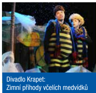
Divadlo Krapet: Zimní příhody včelích medvídků

Letošní rok je nejen rokem olympiády, ale také Praha se pro rok 2016 honosí přívěskem „Evropské hlavní město sportu“. Proto i park Přátelství bude zasvěcen od 14 do 18 hodin sportu. Cestou sportovců vás provedou organizace, spolky, kluby a sdružení z Prahy 9. Nabídka je pestrá od bojových sportů přes atletiku a kopanou po cyklistiku či tanec. Cestu k aktivnímu, zdravému stylu života ukáže zájemcům Dům dětí a mládeže Praha 9, Centrum volného času Prosek, Sam a spol., Devítka v pohybu, Horoguru, Atletika človíček, Pražské mažoretky TJ Sokol Vysočany, Spartak Hrdlořezy aj. Některé sporty se provedou i na pódiu.