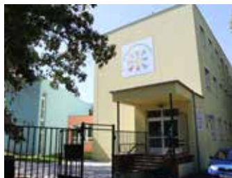
Nový pavilon se dvěma třídami v MŠ U Vysočanského pivovaru

V roce 2013 v areálu školky U Vysočanského pivovaru byly během necelého roku vybudovány dva zcela nové zděné pavilony a rekonstruována byla původní zděná budova. Stavba těchto pavilonů přišla městskou částí Praha 9 na 39,5 milionu korun s tím, že tře-