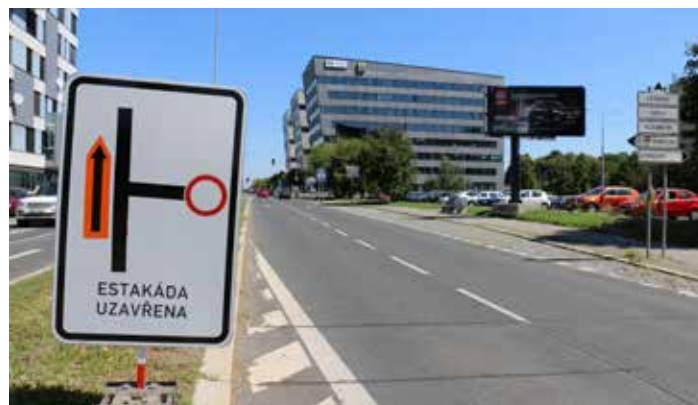
Práce na znovuzprovoznění Vysočanské estakáda budeme dále sledovat a informovat o nich.

Pražské vodovody a kanalizace okamžitě po propadu zahájily práce na rekonstrukci kanalizační stoky, jsou vybudovány tři těžní šachty a vyražen tunel v délce zhruba 15 metrů, ve kterém probíhá její sanace, a to v hloubce sedmi metrů. „O dalším postupu oprav ve Vysočanské ulici budeme jed-