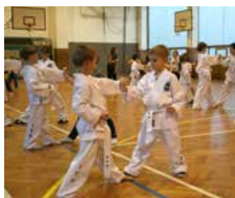
V Litoměřické se věnují dětem