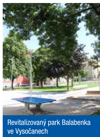
Revitalizovaný park Balabenka ve Vysočanech

speciálním pódiu vystoupil kapelník Golden Big Bandu Prague Petr Sovič se svým swingovým kvartetem. O smích a pohodu se postaral také klaun, nechyběl skákací hrad, všechny děti dostaly cukrovou vatu zdarma a zaujaly je ukázky bojového umění taekwondo WTF a chanbara, což