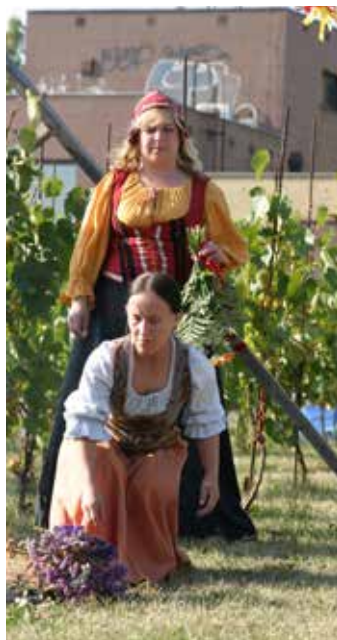
Z obřadu „Zavírání hory“ v podání shš Rebel

Doprava: bus č. 140 zastávka Kelerka, Prosecká ulice u Bobové dráhy. Více na www.machalka.cz