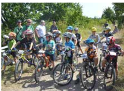
Ze závodů dětí

Odpolední program je věnován čtyřem závodům kadetů, juniorů a dospělých. Závodí se na 40 minut a do jednotlivých závodů se nasazuje podle výkonnosti závodnic a závodníků. Proto prosím věnujte vyplnění registračních údajů pozornost. První závod nejslabší kategorie startuje ve 13 hodin (liga D) a ihned po dojetí následuje vyhlášení. Další pak navazují ve 14 hodin (liga C), 15 hodin (liga B) a nejlepší se postaví na start v 16 hodin (liga A).