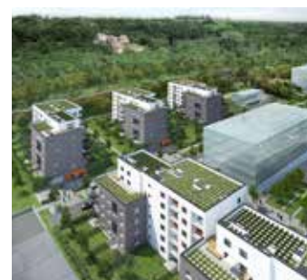
Budoucí podoba Tulipa City ve Vysočanech

plánuje na pozemku o ploše 15 hektarů vybudovat kompletně novou čtvrť AFI City. Za architektonickým návrhem stojí studio CMC Architects a zastoupeny v ní budou nejen rezidenční domy, ale také kancelářské a obchodní plochy. Více na www.byty-kolbenova.cz , www.afi-europe.eu