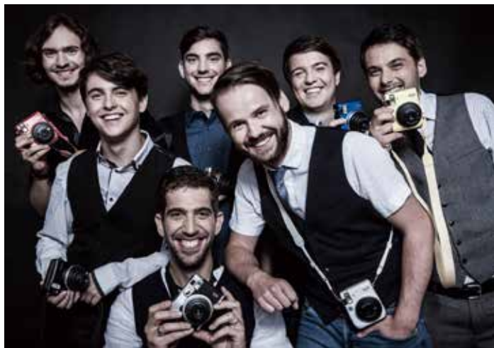
Kapela JELEN zahraje na Svatováclavské pouti v neděli 25. září od 16 hod.

Při poutích se poutníci po opuštění Prahy zastavovali v mnoha místech, kterými procházeli, a navštěvovali tamější kostely. První zastavení bývalo na Proseku. Další pak ve Vínově, Dřevčicích a posléze v Brandýse. V těchto místech byli na procházející návštěvníky náležitě připraveni. Protože pro poskytnutí nutného občerstvení