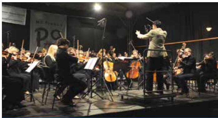
Po loňském úspěchu i letos vystoupí v parku Přátelství Filmharmonie s dirigentem Chuhei Iwasakim

V parku můžete vyzkoušet lezecou stěnu, skluzavku, trampolínu, ti nejmenší skákací hrad a samozřejmě nebudou chybět tradiční lodě na jezírku. Těšit se můžete i na účast našich předních sportovců a olympioniků.