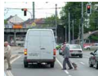
Častým problémem je chybějící nebo nevhodně umístěný přechod

Občané mohou ke zlepšení podmínek pro pěší využít internetový portál www.chodcisobe.cz . Tento nástroj poskytuje prostor pro nahlášení problémů, se kterými se setkáváme jako chodci na svých cestách Prahou. Naše podněty jsou jeho prostřednictvím evidovány, zobrazovány a zasílány samosprávám městských částí nebo magistrátu k řešení. Velkým přínosem je, že se na portálu následně dozvíme, jak je náš podnět řešen. <