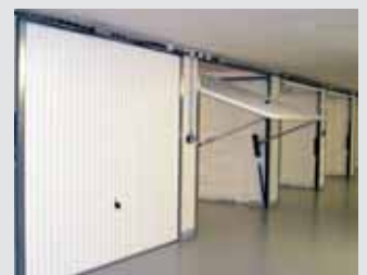
Uzavíratelné garáže v Lovosické

Samostatné uzavíratelné garáže (nikoliv garážová stání) jsou k pronájmu v garážích v Lovosické ulici na Proseku. Za garáž zájemci (nemusí mít trvalé bydliště na „devítce“) zaplatí měsíční nájem 1200 Kč. Termín prohlídky si lze domluvit na tel.: 776 616 616 - Milan Tuček.