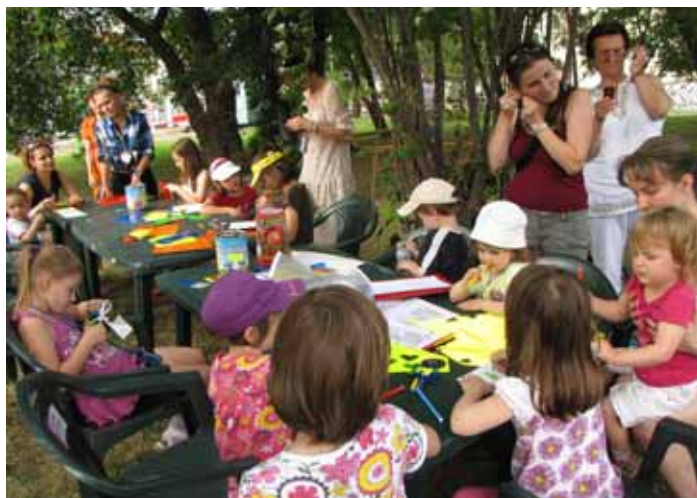
Dětská dílna na nám. OSN (Mikroklima 2011)

Také MČ Praha 9 se i v souvislosti s projektem INVOLVE, ERDF, program INTERREG IVC, do Evropského týdne mobility zapojí. Letošní ročník akce Mikroklima je zaměřený právě na téma šetrné dopravy a kvality ovzduší. Akcí, která