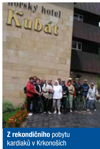
Z rekondičního pobytu kardiaků v Krkonoších

Text a foto: Hana Foltýnová, členka RK SPCCH