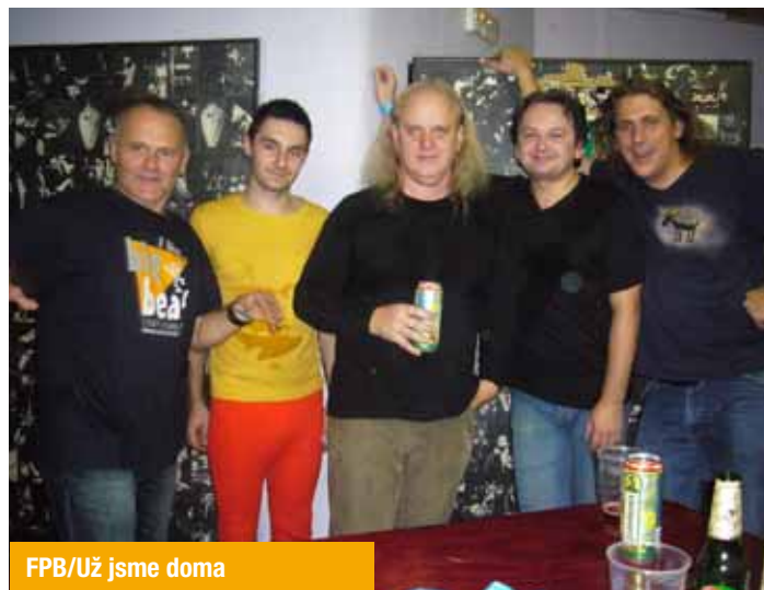
FPB/Už jsme doma

Předposledním souborem letošního PODVINÍ budou místní temní patrioti, podzemní orchestr BBP . Početný soubor po pěti letech natáčí nové CD Je čas, které by mělo vyjít na jaře příštího roku, a to na dobré značce Guerilla Records. Na tomto festivalu BBP vystupují zpravidla s hosty a je velmi pravděpodobné, že ani letos nebude o překvapení nouze. A hybe-li komerce světem, rozhodně nehýbe tímto podivným souborem. Už téměř třicet let si kráčí svou cestou a je dost patrné, že na tom