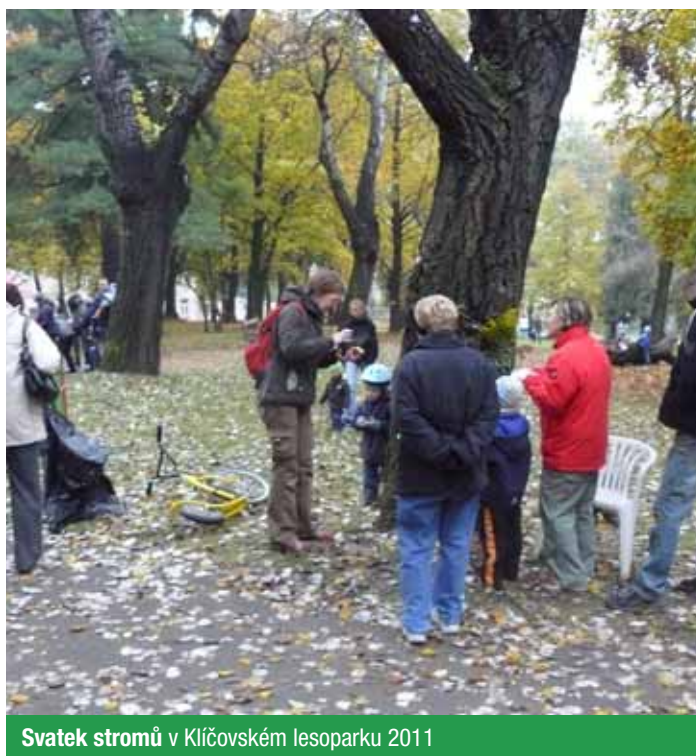
Svátek stromů v Klíčovském lesoparku 2011

A co má Svátek stromů společného s podporou šetrné dopravy?