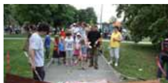
Odpoledne v parku Přátelství plné her