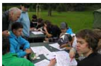
Studenti hledají vhodné pěší trasy (Mikroklima 2010)