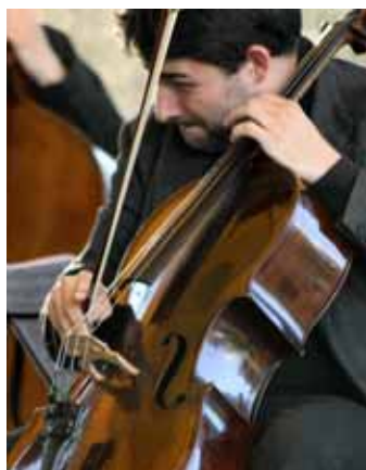
Večer Proseckého podzimu již tradičně patří výborné hudbě