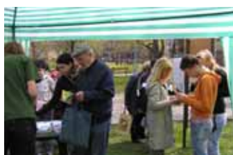
Občané se zajímají o chráněná území (Mikroklima 2007)