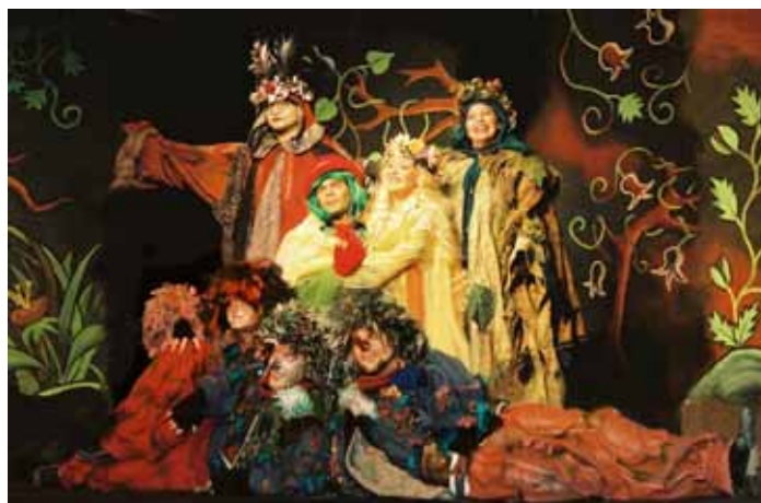
Z představení Dobrodružství hastrmana Tatrmana

Ještě než v parku Přátelství zazní první tóny děl světových hudeb-