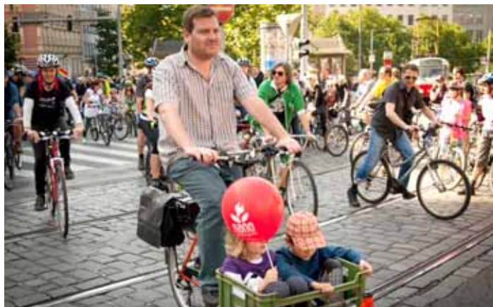
Velká podzimní cyklojízda 2011

Auta představují vážné nebezpečí zejména pro nejzranitelnější účastníky provozu, mezi něž patří chodci, cyklisté, děti a spoluobčané s handicapem. Těm nejslabším – dětem, starším lidem a handicapovaným spoluobčanům – nebezpečné silnice dokonce často zabírají v samostatném pohybu. Přestože pěší cesty zabírají ze všech druhů dopravy nejméně prostoru, chodci neprodukuje žádné emise ani hluk a nikoho neohrožují a navíc je chůze prospěšná zdraví a nezbytná pro správný fyzický i psychický vývoj dětí, Praha na ni ve strategických dokumentech nepamatuje. Ačkoli pěší doprava zajišťuje 25 % všech vnitroměstských cest, není zmíněna v dokumentech, jako je Dopravní politika, ani ve Stra-