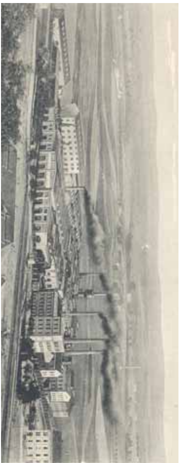
Stánek staré Kolbenky pořízený ze sbuhu nad Příkladněnkou a cukrovarem. Na útrovnoutě přejezdu koleji železniční trati zatím nejsou patrné základy. Celý tovární komplex, ze kterého kouří pát tučen komínů, stojí ještě daleko za Vyšehradem uprostřed poli.

V roce 1899 byla ve strojírnách založena lokomotivka. Těmž třicet let tedy trvalo, než se lokomotiva z obálky akcie dostala do výrobního programu. O necelý rok později vyjela ze vrat první, první z Českomoravské a první lokomotiva vyrobená v českých zemích vůbec. Během následujících tří let to bylo již 87 lokomotiv, z toho pět rychlokových. Jedna z nich dosáhla při úřední zkoušce na trati Vídeň – Sv. Hipolit v tehdejší době nesyňhané rychlosti – 148 km v hodině. Světový rekord.