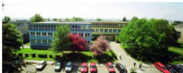
ZŠ Litvínovská 600