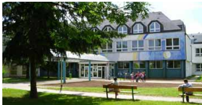
ZŠ Litvínovská 500

Praha 9 otevře v září rekordních sedm přípravných tříd ve svých čtyřech základních školách. „Staneme se tak jedinou městskou částí, která nabídne vzdělávání v přípravných třídách téměř ve všech základních školách ve svém obvodu,“ uvedla radní MČ pro školství Zuzana Kučerová.