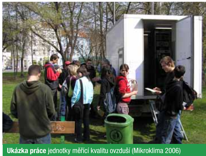
Ukázka práce jednotky měřící kvalitu ovzduší (Mikroklima 2006)