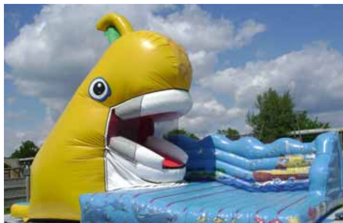
Děti se mohou nechat spolknout obrovskou nafukovací zlatou rybou, v níž je čekají plochy na skákání a skluzavka