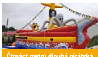
Čtrnáct metrů dlouhá pirátská loď kromě jiného houpáním simuluje plavbu na vlnách

Generální partner: Česká spořitelna, a. s.