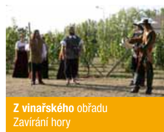
Z vinařského obřadu Zavírání hory