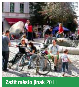
Zažít město jinak 2011

tegickém plánu hlavního města Prahy jako samostatný druh dopravy, který si zaslouží zvláštní podporu a rozvoj. Opomíjení systému pěších cest vede k takovému rozvoji ostatních druhů dopravy, který zase zpětně vytváří pro chodce nové a nové bariéry. Současný stav pěších cest a nerovnoprávné postavení chodce v systému městské dopravy odrazuje od chůze i ty, kteří by rádi dali přednost zdravějšímu pohybu. <