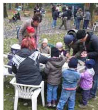
Kašánková dílna v obležení (Svátek stromů 2011)

Přece zvolené dopravní prostředky! A navíc se Svátek stromů zapojuje do celopražské sousedské slavnosti Zažít město jinak a s ním spojené Velké podzimní cyklojízdy. Zažít město jinak organizuje iniciativa AUTO*MAT a více informací o projektu najdete na www.auto-mat.cz/aktivita/zazit-mesto-jinak/ .