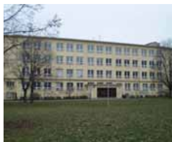
ZŠ Na Balabence