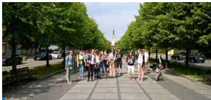
Alejí na Jasnou Horu

V pondělí 5. června jsme se jako zástupci škol Prahy 9, Zá-