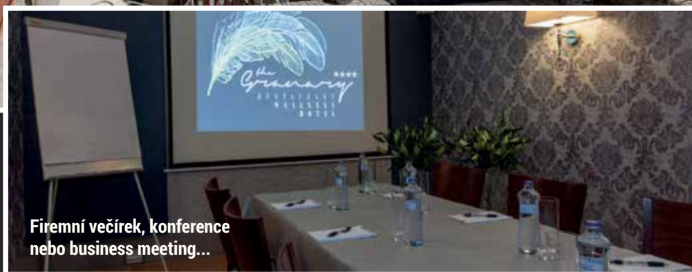
Firemní večírek, konference nebo business meeting...