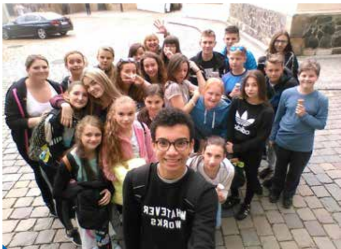
Na Karlově mostě

Výměnný pobyt mezi školami ZŠ Litvínovská 500, ZUŠ Prosek a partnerskou Základní školou č. 48 v Čenstochové v Polsku se uskutečnil 23. až 26. května, kdy polské děti přijely do Prahy 9, a pokračoval od 5. do 8. června výjezdem českých žáků do Čenstochové.