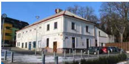
Budova hostince U Brabců dnes

Zelení hostince u Brabců chtějí. Požadují ale otevřenost radnice. V květnovém čísle Devítky jste možná četli článek o směně pozemků bývalých garáží Pod Krocínkou za hostinec U Brabců. V něm jsme jako Zelení byli nařknuti z toho, že se nám směna „nelíbí“. Z tohoto prostého sdělení čtenář snadno nabude dojmu, že se záměrem MČ nesouhlasíme. Úsměvně, když jsme téměř rok podporovali snahu hostinec nezbourat. Na dubnovém zastupitelstvu nám pouze vadila rychlost, jakou mělo ke směně dojít.