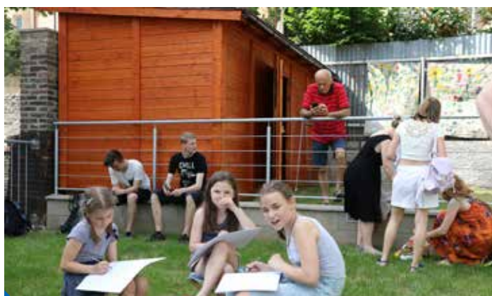
Místo pro výtvarníky