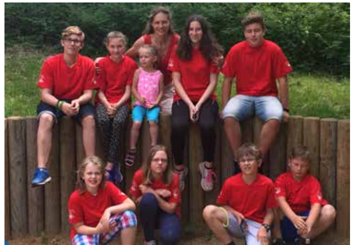
Mladí cyklisté ze ZŠ Litvínovská 600 patří již několik let k úspěšným účastníkům dopravních soutěží. Ani letošní rok nebyl výjimkou.