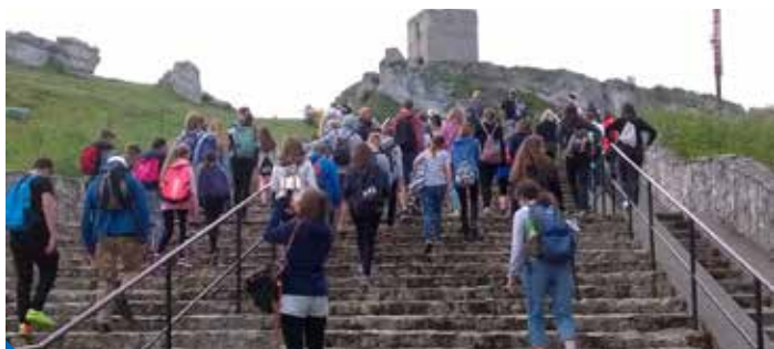
Cesta na hrad Holstein