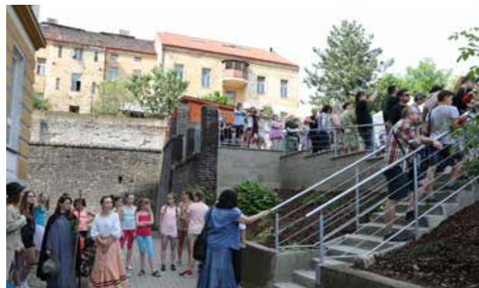
Revitalizací prošla i zanedbaná školní zahrada