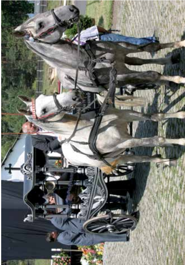
Koně doprovázeli člověka i na jeho poslední cestě

jeho rozebrání při opravě jsme mohli posoudit pracnost při výrobě náboje, jednotlivých paprsků a loukotí. Bez jediného hřebíku nebo šroubu. A což takový žebřík! To byl základní zemědělský vůz. Sestavený téměř jako stavěnice a snadno rozebratelný. A přitom snesl i těžký náklad v hrboletém terénu nebo jízdu tryskem po silnici. Jeden z těchto vozů se proslavil i jako předmět doličný v nedělním sloupku ze soudní síně v dávném tisku uloženém v našem archivu: