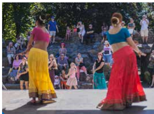
Foto z minulých ročníků BAREVNÉ DEVÍTKY

Letošní ročník multikulturního festivalu BAREVNÁ DEVÍTKA proběhne v sobotu 26. srpna opět v parku Podviní v Praze 9.