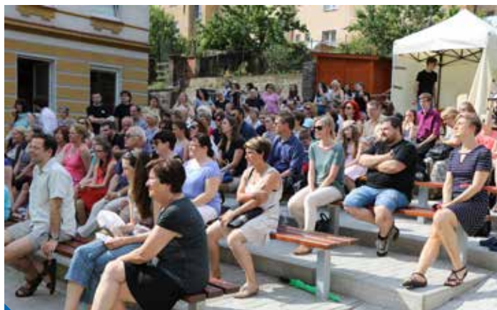
Nový zahradní víceúčelový amfiteátr ZUŠ Prosek

Víceúčelový amfiteátr v ZUŠ Prosek není jen divadelní scénou s hledištěm pod otevřeným nebem. Sloužit bude jako venkovní výukový prostor žákům všech čtyř uměleckých