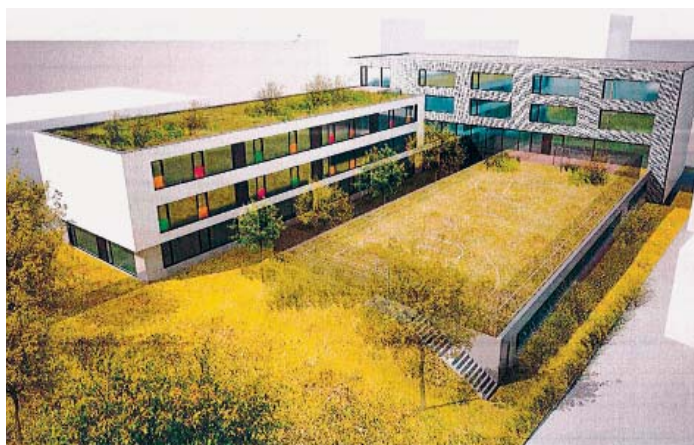
Projekt nové ZŠ a MŠ U Elektry

mentaci potřebnou pro vydání stavebního povolení.