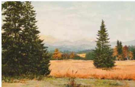
Stanislav Čapka: Beskydy

Společná zemská výstava s názvem Malující železničáři se koná ve dnech 13. až 15. března v Galerii 9 ve Vysočanech. Vernisáž se uskuteční v pondělí 12. března v 15.30 hodin.