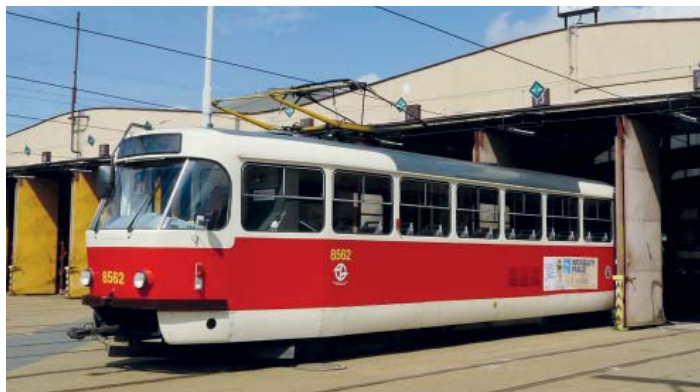
Vozovna v Hloubětíně

Hloubětínská vozovna, která je paradoxně v síti pražských tramvají nejmladší, se bude vzhledem k jejímu havarijnímu stavu bourat. Na jejím místě by měla do konce roku 2021 vyrůst nová vozovna, která by co nejvíce vyhovovala současným potřebám.