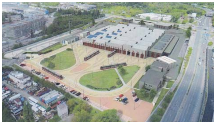
Tak by měla vypadat nová hloubětínská vozovna

V roce 2014 vypracoval Dopravní podnik Praha plán