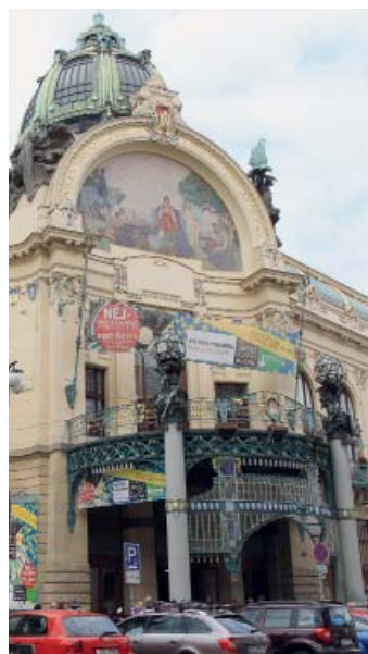
Obecní dům

Exkurze s výkladem včetně návštěvy Smetanovy síně. Průvodkyní je Blanka Čekánová. Zvýhodněné vstupné pro seniory MČ Praha 9. Zájemci se osobně přihlásí v Galerii 9 do 16. března 2018. Nutno zaplatit 100 korun.