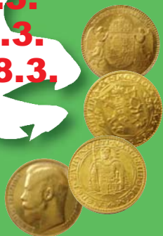
(ZLATÉ MINCE, ŠPERKY, atd.)