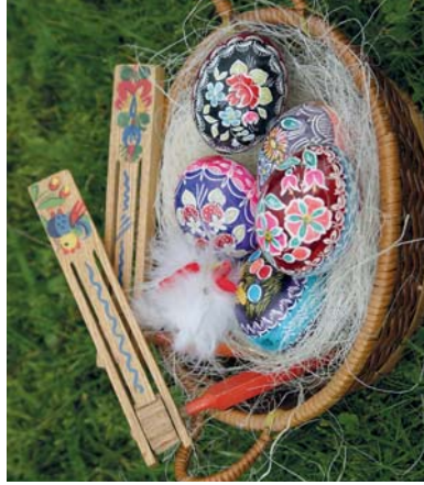
Od Zeleného čtvrtka do Bílé soboty, kdy se v kostelích nezvonilo, oživaly se odevšad dřevěné kladky a přeháňky

den jedli jen zelenou stravu – špenát, zelí, aby byli po celý rok zdraví. A pokud chcete, aby se vás držely peníze, nic si tento den nepřijívejte a s nikým se nehádejte. A než podle tradice odletí všechny zvony do Říma – ve čtvrtek utíhají až do Bílé soboty – zacinkajte si penězi.