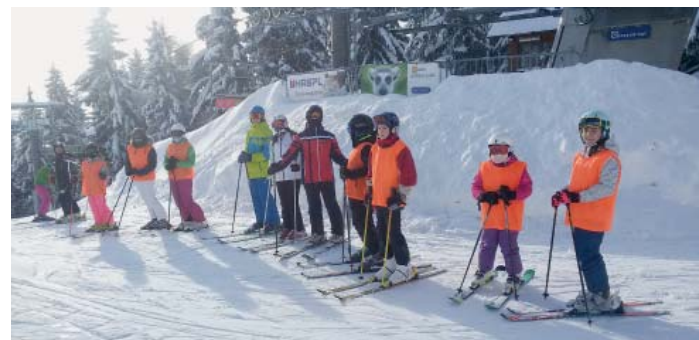
Ze zimního soustředění proseckých taekwondistů v Krkonoších

Letos v lednu už po jednadvacáté vyrazili proseckí taekwondisté z Litoměřické na zimní soustředění.