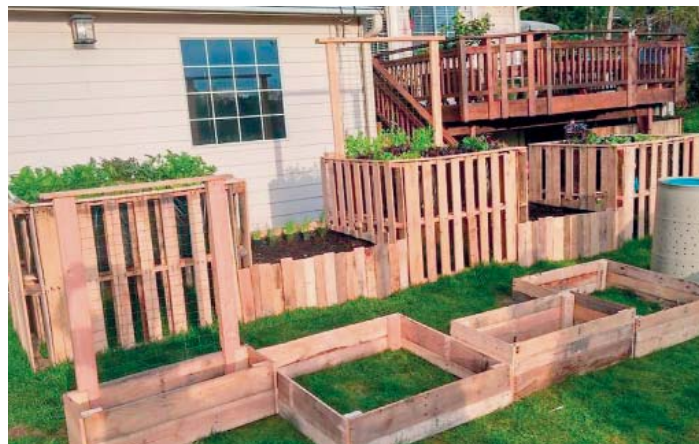
Záhony z palet

Každý, koho myšlenka komunitní zahrádky Paletka oslovila, může přijít na další setkání 7. března od 17 hodin přímo do areálu MŠ Pod