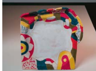
Dana Nováková: Lampa