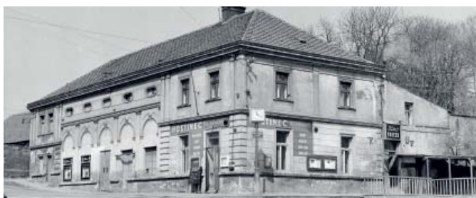
Hostinec U Brabců

MČ Praha 9 připravuje rekonstrukci budovy hostince U Brabců na Starém Proseku.