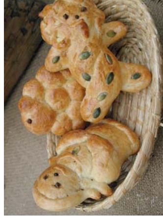
Na Zelený čtvrtek se také pekly jláďase, obrádní pečivo z kynutého těsta. Poitřené medem se jedly pro zdraví