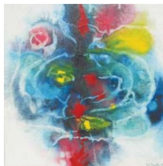
Můj dům je ve větvích

Co se týče malby, klade důraz na tvarosloví a působivost barev: mistrovsky pracuje s jejich sugestivní a emoční hodnotou a významovostí. Prostřednictvím barevných valérů, podobajících se hudebním stupnicím, přitom ani tak nezachycuje skutečnost jako její obsah – už proto, že vnější rysy ji definují jen přibližně, zatímco vnitřní významy ji vystihují přesněji. Abstraktní