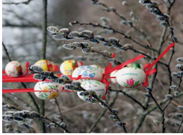
Symbolem Velikonoc jsou větvíčky jivy – „kočičky“. V evropské kultuře nahradily palimové ratolesti, kterými byl Ježíš při svém příjezdu do Jeruzaléma vítán. Na Velký pátek pomáhá vrbový proutek otevřít zemi i skálu a ukázat skryté poklady. A chcete-li mít zdravé a dlouhé vlasy, učes- te se tento den pod velkou vrbou

Pijte páni, pijte, jen se neopijte, a nám taky připijte, až já budu mládencem, připiju vám i s věncem.