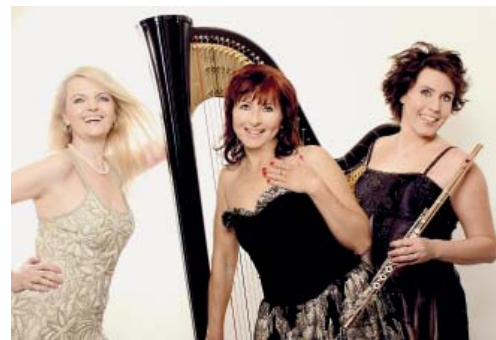
Musica Dolce Vita