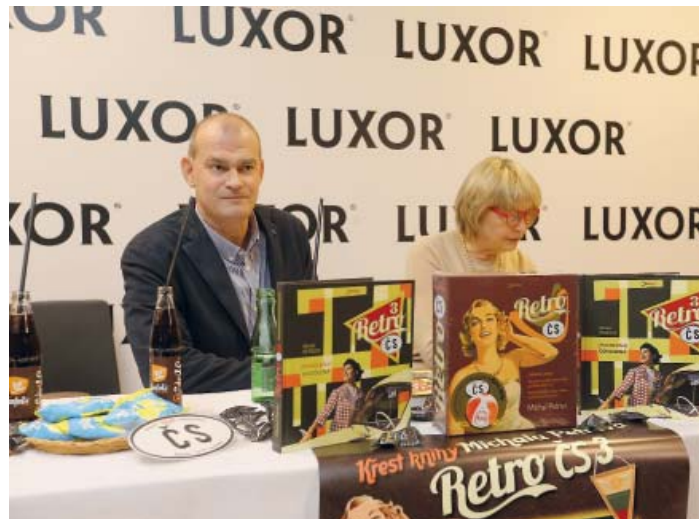
Ze křtu knihy Retro ČS 3

Nebylo to zase tak složité, ale spíš pracné. Chtěl jsem text doprovodit dobovými ilustracemi – fotografiemi a starými reklamami, nechtěl jsem mít nic stylizovaného, nějaké novodobé quasiretro, které ztrácí na autentičnosti. A připadalo mi logické, že se opřu o archivy časopisů, které vycházely před lety a vycházejí dodnes. Digitalizace na úrovni Národní knihovny byla tristní, a tak jsem se obrátil na redakce periodik přímo. Jenže spousta změn vlastníků a stěhování zapříčinily to, že redakce žádné archivy nemají – s jedinou výjimkou, kterou představovalo vydavatelství Sanoma s docela bohatým archivem Květů, což je nejdéle vycházející časopis u nás. Tehdy sídlily na Pankráci a já tam čtvrtrok chodil po práci do sklepa s počítačem a skenerem a po-