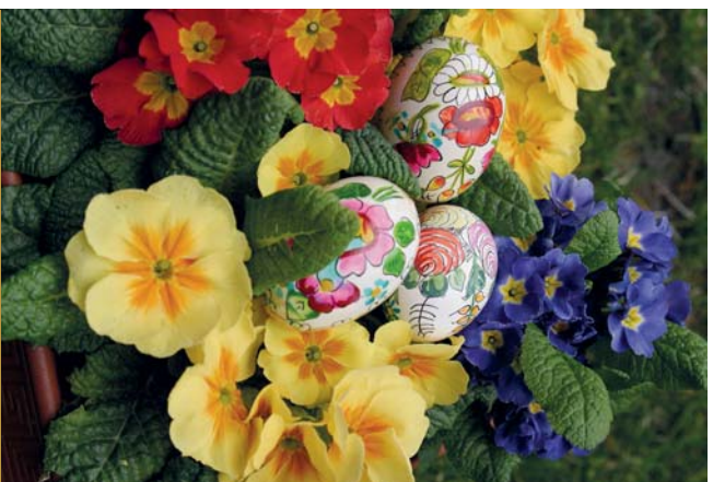
Petrklíče: Klíče k Jaru – nedají se přehlédnout

Podle staré tradice se svíce zapaluje od posvěceného ohně na počátku liturgie konající se v noci z Bílé soboty na neděli, v níž Kristus vstal z mrtvých. Tato slavnost Vzkříšení se zahajuje vnesením zapálené svíce do tmavého, zhasnutého kostela. Tak si křesťané připomínají, jakým zásadním obrátem je Kristovo vzkříšení – noc, která se proměňuje v den.