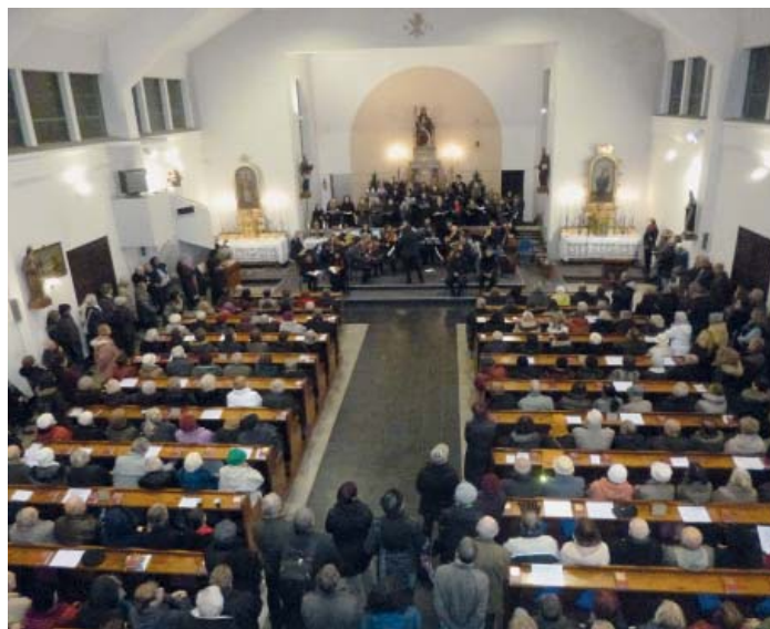
Přijďte si poslechnout symfonii Veliká noc do svatyně Krista Krále

Nejprve byly osloveny nejrůznější profesionální orchestry, ale ukázalo se, že lze sehnat