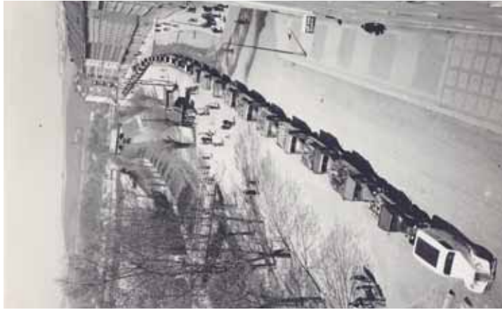
Autá určená k rozvozu vysočanských výrobků

2. března 1901 převzal ještě nezletilý syn Bedřich Frey ml. a řídil ji prakticky až do zavedení státní správy v roce 1945.