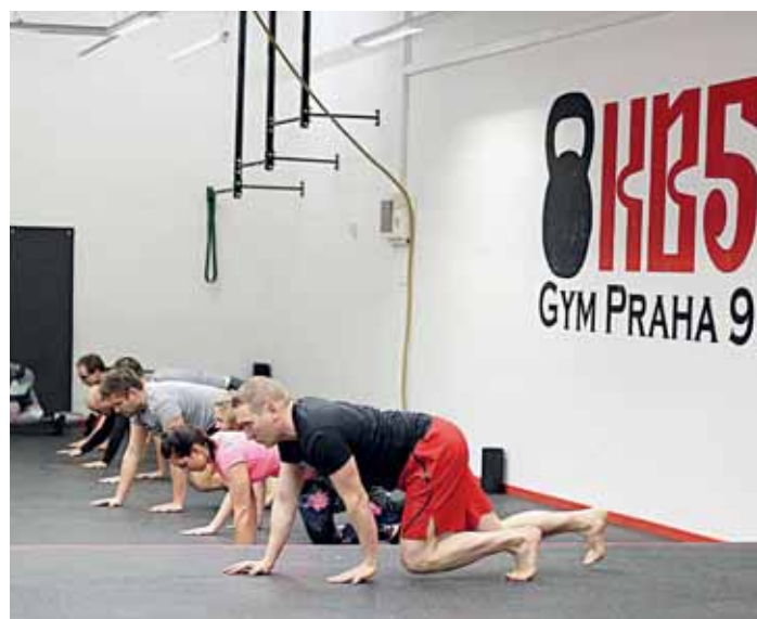
Lekce v KB5 jsou určeny pro každého – muže i ženy bez věkového omezení.