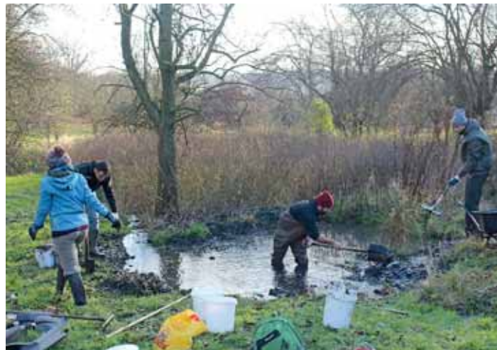
Spolek Arnika s příznivci pravidelně pořádá úklidové akce pražských toků a tůň. Na podzim zorganizoval také sbírání odpadků v korytě Mratinského potoka v Ďáblicích a v korytě Rokytky ve Vysočanech.

Za posledních sto let zmizelo v Praze, ale i v celé České republice nejen mnoho tůň, ale i mokřadů a rozlévajících se toků, kde se obojživelníci mohli rozmnožovat a vyvíjet. Je tedy nutné starat se o tůně