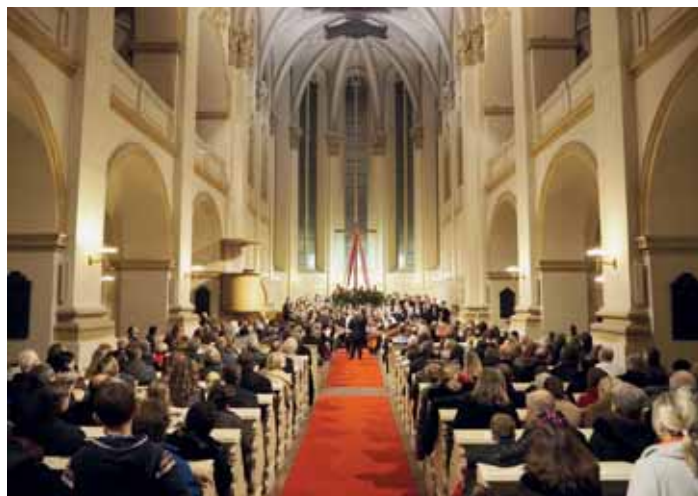
Vánoční koncert U Salvátora.