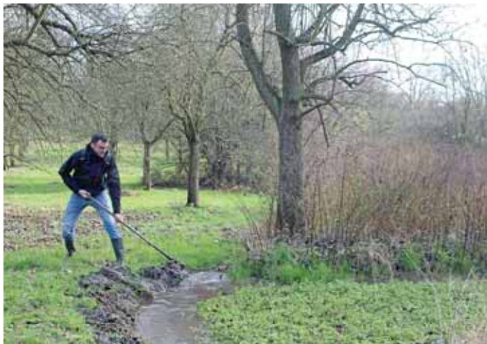
Dobrovolníci z Arniky tůň v klíčovském sadu uklidili tak, aby se vzácným a chráněným druhům v lokalitě dařilo i v nadcházející sezoně.

V neděli 26. listopadu 2017 čistila Arnika spolu s dobrovolníky tůň v klíčovském sadu v pražských Vysočanech. Společně tak připravovali lepší podmínky pro tamní obojživelníky, kteří jsou v české přírodě ohroženi kromě jiných důvodů také nedostatkem vhodných lokalit k životu.