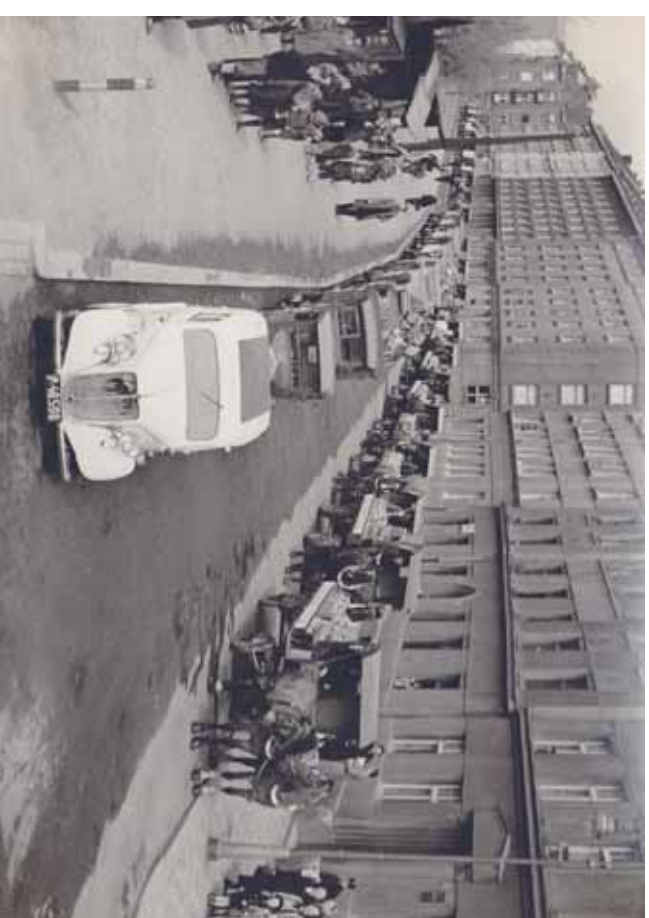
Autá a koňské povozy