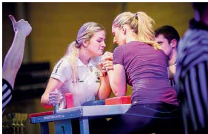
Soutěž v páce mohou absolvovat muži i ženy.