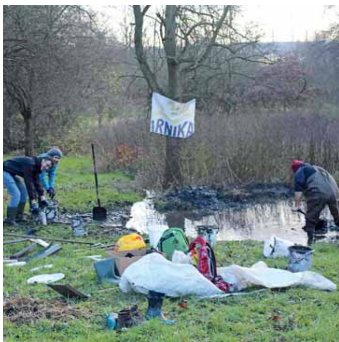
Klíčovské tůně jsou útočištěm chráněných druhů obojživelníků.

Pro obojživelníky jsou smrtící nebezpečné látky, které se dostávají do prostředí, neboť snadno pronikají přes jejich tenkou kůži a rychle zasahují jejich organismus. Velkým nebezpečím jsou ale i překážky v migraci dospělců k vodním plochám, jako jsou silnice a dálnice.