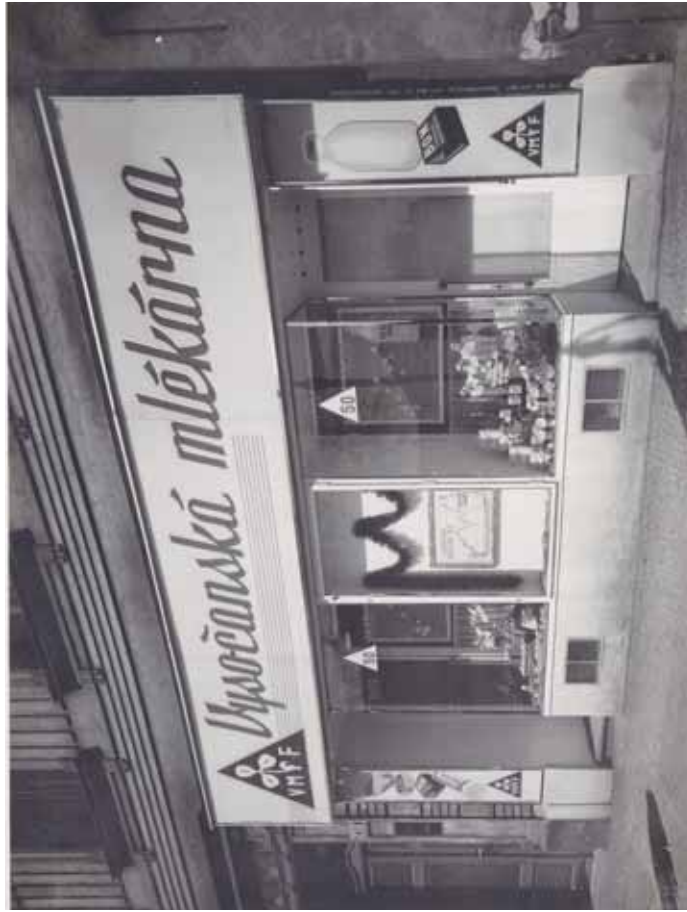
Prodejna mlékárny ve Vysočanech na Královské třídě ép. 212