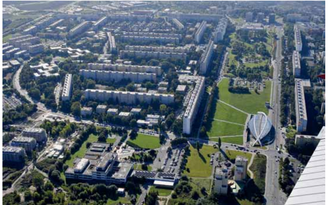
Na plochy mezi ulicemi Jiřetínská a Lovosická u stanice metra Střížkov by měl být rozšířen park Přátelství.

Předmětné pozemky na Střížkově o celkové rozloze 23 640 m 2 vlastní společnost OC9 s. r. o. a podle platného územního plánu jsou smíšeným územím městského jádra, kde se smí stavět bytové domy, nákupní centra, kanceláře apod. Proti masivní zástavbě tohoto prostoru v blízkosti stanice metra Střížkov však vedení MČ Praha 9 aktivně vystupuje již od konce 90. let a v roce 2009 otevřeně deklarovalo ochotu jednat s majitelem pozemků o jejich možné směně nebo odkoupení. V roce 2014 po mnoha jednáních se zdálo, že by mohlo dojít k dohodě. Společnost OC9 tehdy požadovala směnu ze-