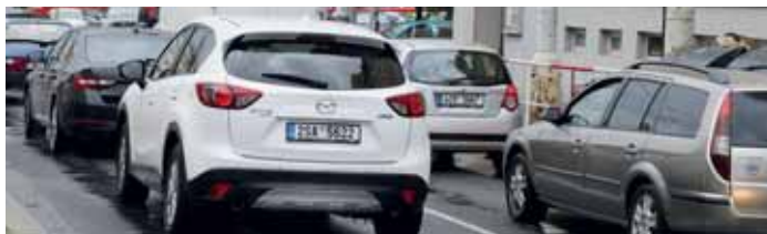
Praha není přívětivá k motoristům, kteří městem projíždí, ani k těm hledajícím místo k zaparkování.

„V neposlední řadě jsme nechtěli odstříhnout podnikatele v Praze 9 od jejich zákazníků, kteří k nim v mnoha případech za nákupy a službami přijíždějí automobily. Po mnoha jednáních, jak s hl. m. Prahou, tak obyvateli MČ Praha 9, jsme přednesli zásadní připomínky k podobě jednotného systému na území MČ Praha 9,“ vysvětluje radní pro dopravu MČ Praha 9 a pokračuje: „Jako systém, který by toto splnil, jsme vyhodnotili systém ZPS v podobě fialové zóny s cenovou sazbou