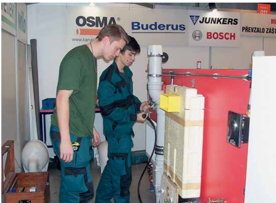
Praktická část v soutěži.

A právě dvojice současných studentů Střední odborné ško-