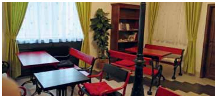
Přijďte na literárně magická odpoledne pod lampou do Coffee-inn

Akce pro seniory z městské části Praha 9, kteří mají trvalé bydliště v působnosti úřadu Sokolovská 14/324, Praha 9.