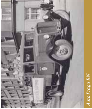
Auto Praga RN