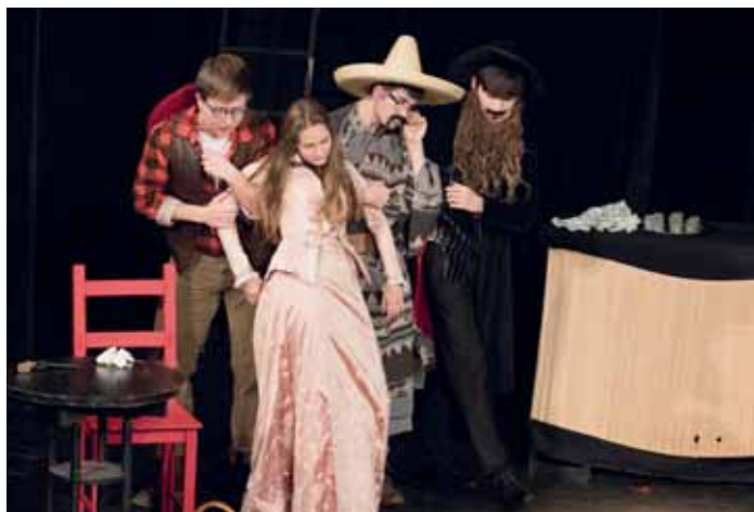
Z představení Limonádový Joe.

V sobotu se nejdříve předvedla kvarta se svým představením Soutěž. Poněkud absurdní příběh o vědomostní soutěži pořádané cholericou moderátorkou, ve které se utkají přechytralý Jiří a postarší, zapomětlivá Jiřina, nepochybně všechny diváky velmi pobavil. Poté, co divadelní soubor STOPA Podještědského gymnázia odehrál svůj kousek Google Shakespeare, následovala opět kvarta, tentokrát s představením The Room. Zábavná etuda o vztazích a mimozemšťanovi